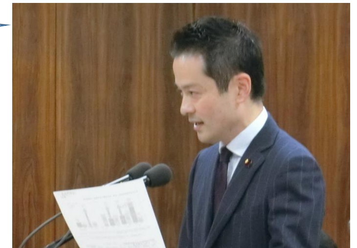
1世帯あたり自動車関連税の年間負担額（作成：自動車総連）